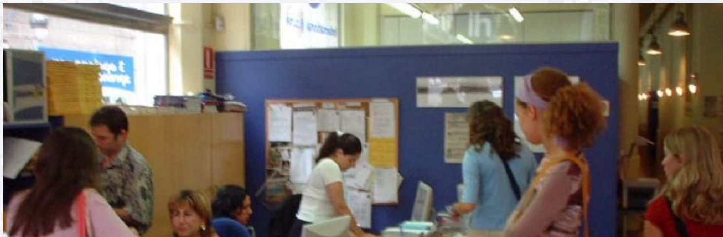
Barcelona - jetzt - Spanisch lernen mitten im Leben