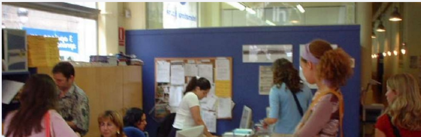
Barcelona - jetzt - Spanisch lernen mitten im Leben