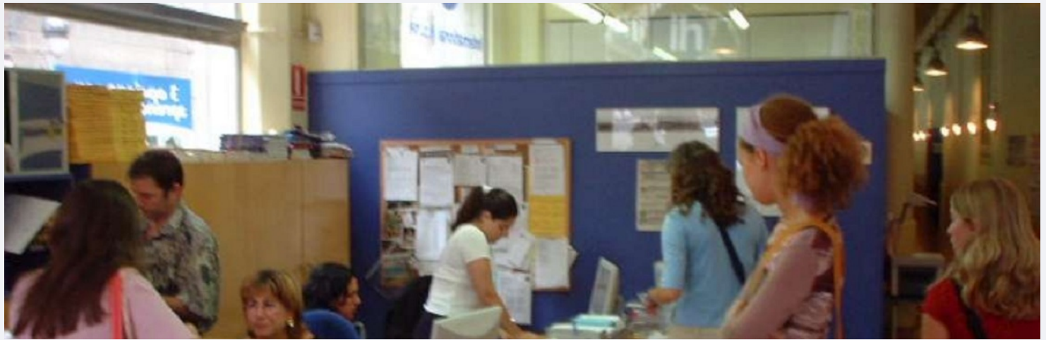
Barcelona - jetzt - Spanisch lernen mitten im Leben